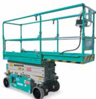
Estensione manuale piattaforma 1 m