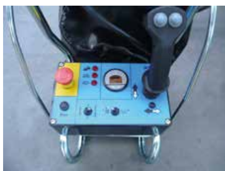
Quadro comandi sulla piattaforma semplice e intuitivo