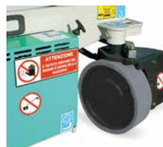
Sterzo idraulico a 90°