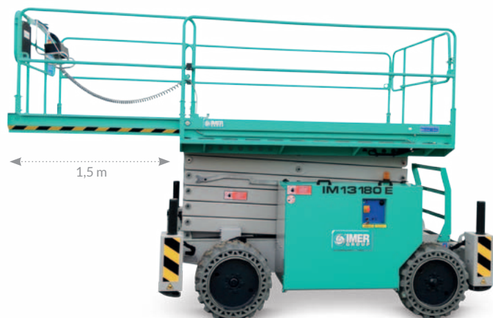
Estensione manuale della piattaforma di 1,5 m per una lunghezza complessiva di 4,2 m