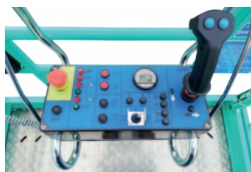
Quadro di comando semplice e intuitivo asportabile dalla navicella per carico/scarico della macchina